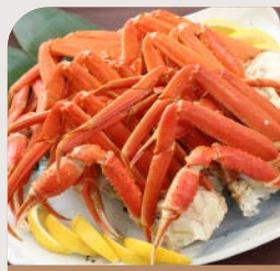
ボイルズワイガニ