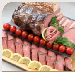
<実演メニュー> 北海道産牛肉の ローストビーフ

期間：2026/7/1（水）～7/17（金）、8/24（月）～9/30（水） ※2026/7/18（土）～8/23（日）は、料金と内容が変更になります