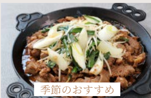
季節のおすすめ 北海道名物 ラム肉ジンギスカン