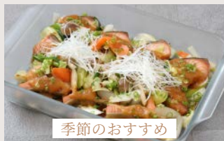
季節のおすすめ 北海道産 鮭のチャンチャン焼き