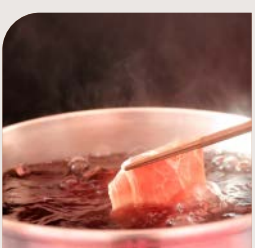
<名物> 赤ワイン しゃぶしゃぶ