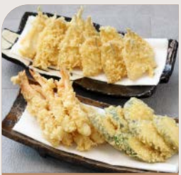
<実演メニュー> 天ぷら (エビ・キス・野菜)