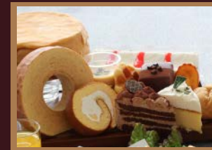
●シャトレーゼスイーツ（ケーキ・アイス）