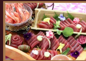
●刺身（マグロ・甘海老）