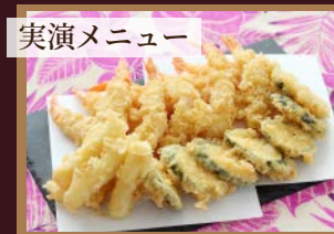
実演メニュー ●天ぷら（エビ・チーズ・野菜）