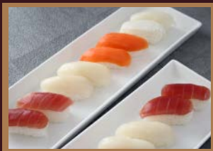
●寿司（マグロ・サーモン・イカ・エンガワ）