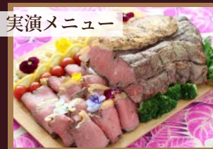
実演メニュー ●北海道産牛肉のローストビーフ