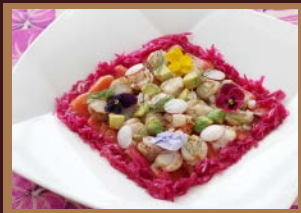
●北海道産帆立貝とアボカドのポキ風とトラウトサーモンのマリネ