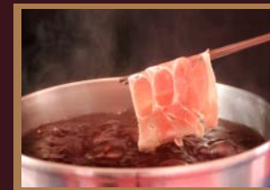
●ワインしゃぶしゃぶ